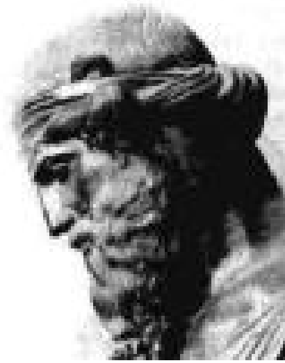
PLATON (427 – 347. pr. n. e.)

" Svaka duša teži dobru i poradi njega čini sve što čini."